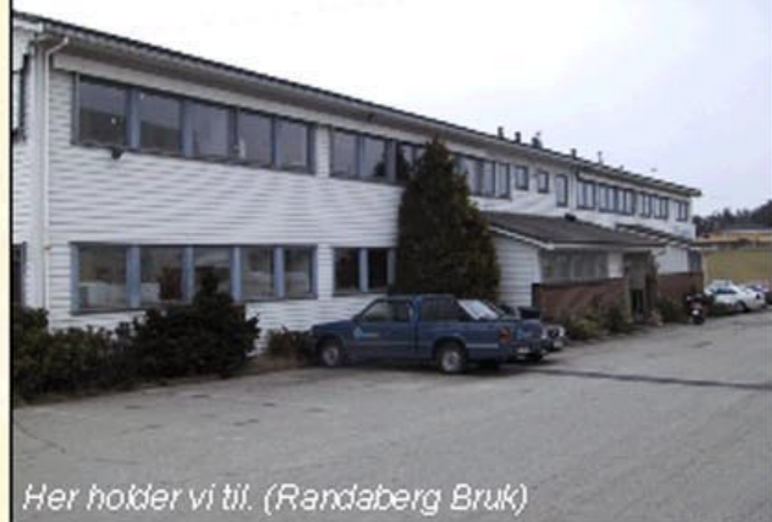
Her holder vi til. (Randsberg Bruk)